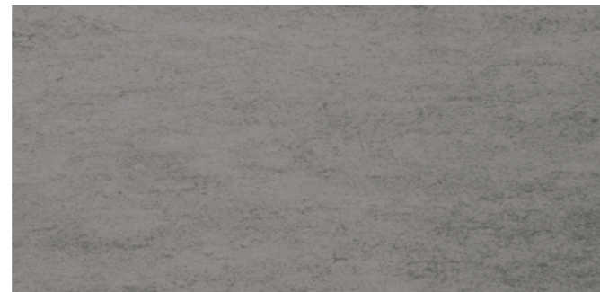
6674 Dunkelaspalt Dark asphalt Asphalte foncé