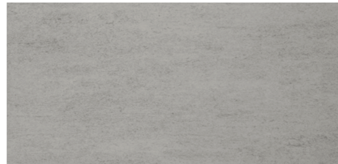
6673 Asphaltgrau Asphalt grey Gris asphalte